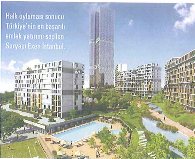
Halk oylaması sonucu Türkiye'nin en başarılı emlak yatırımı seçilen Suryapı Exen İstanbul.