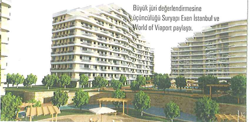
Büyük jüri değerlendirmesine üçüncülüğü Suryapı Exen İstanbul ve World of Viaport paylaştı.