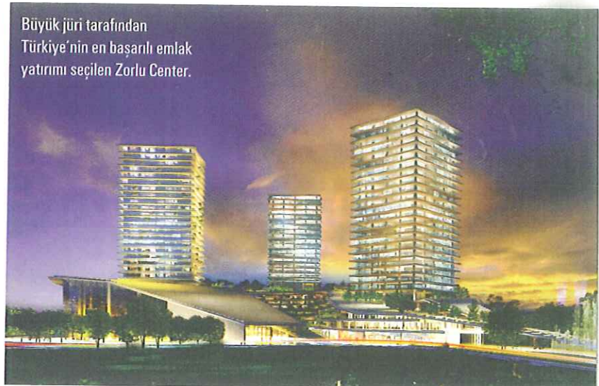
Büyük jüri tarafından Türkiye'nin en başarılı emlak yatırımı seçilen Zorlu Center.